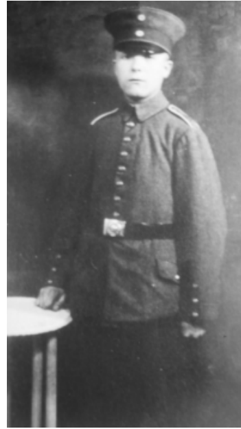
J. Pump 1918, Priv.